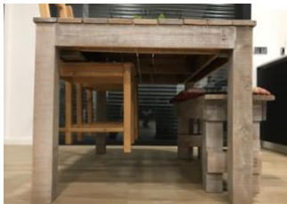
vista de perfil