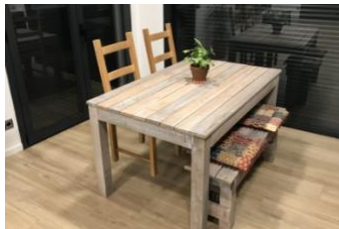
ejemplo del conjunto