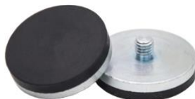
base magnética de neodimio recubierta de Nylon