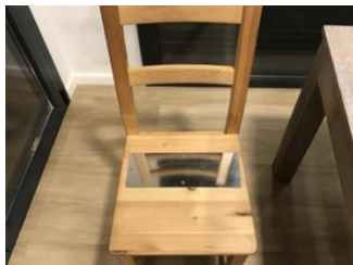
ejemplo de silla