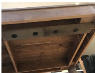
vista inferior de la mesa